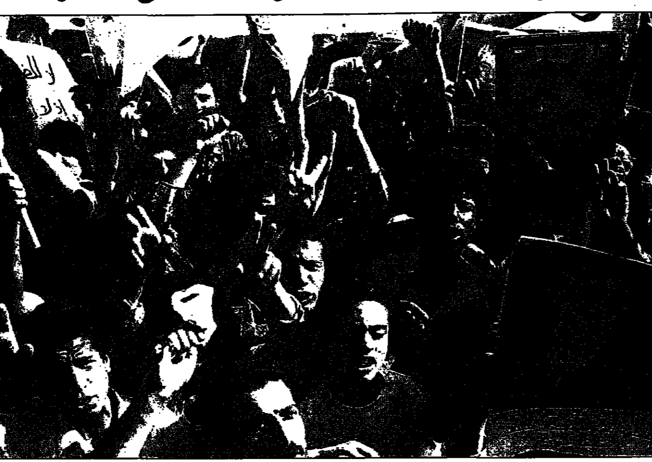
فلسطينيون يتظاهرون في غزة ضد الاستيطان الإسرائيلي

القاهرة - القدس - «القدس العربي» أعلن رابع إسرائيل الجمعة أن الرئيس المصري حسني مبارك خلال لقائه مع بن هادي الحسين رئيس الحكومة المصرية في شرم الشيخ يوم الثلاثاء المقبل سيعرض مبادرة من خمس نقاط لاستئناف المفاوضات السياسية الفلسطينية. وأضاف الرائد أن المبادرة تتضمن: إبطاء الاستيطان في القدس الشرقية، وإجراء محادثات مع الفلسطينيين في شأن العملية السلمية، وإجراء محادثات مع الفلسطينيين في شأن العملية السلمية، وإجراء محادثات مع الفلسطينيين في شأن العملية السلمية.